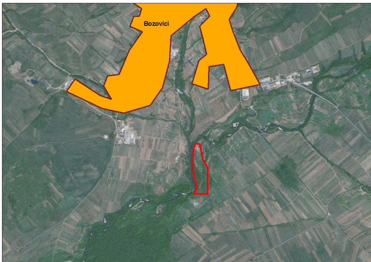
Figura 1. Localizarea perimetrului de exploatare Lunca Băniei în raport cu localitățile