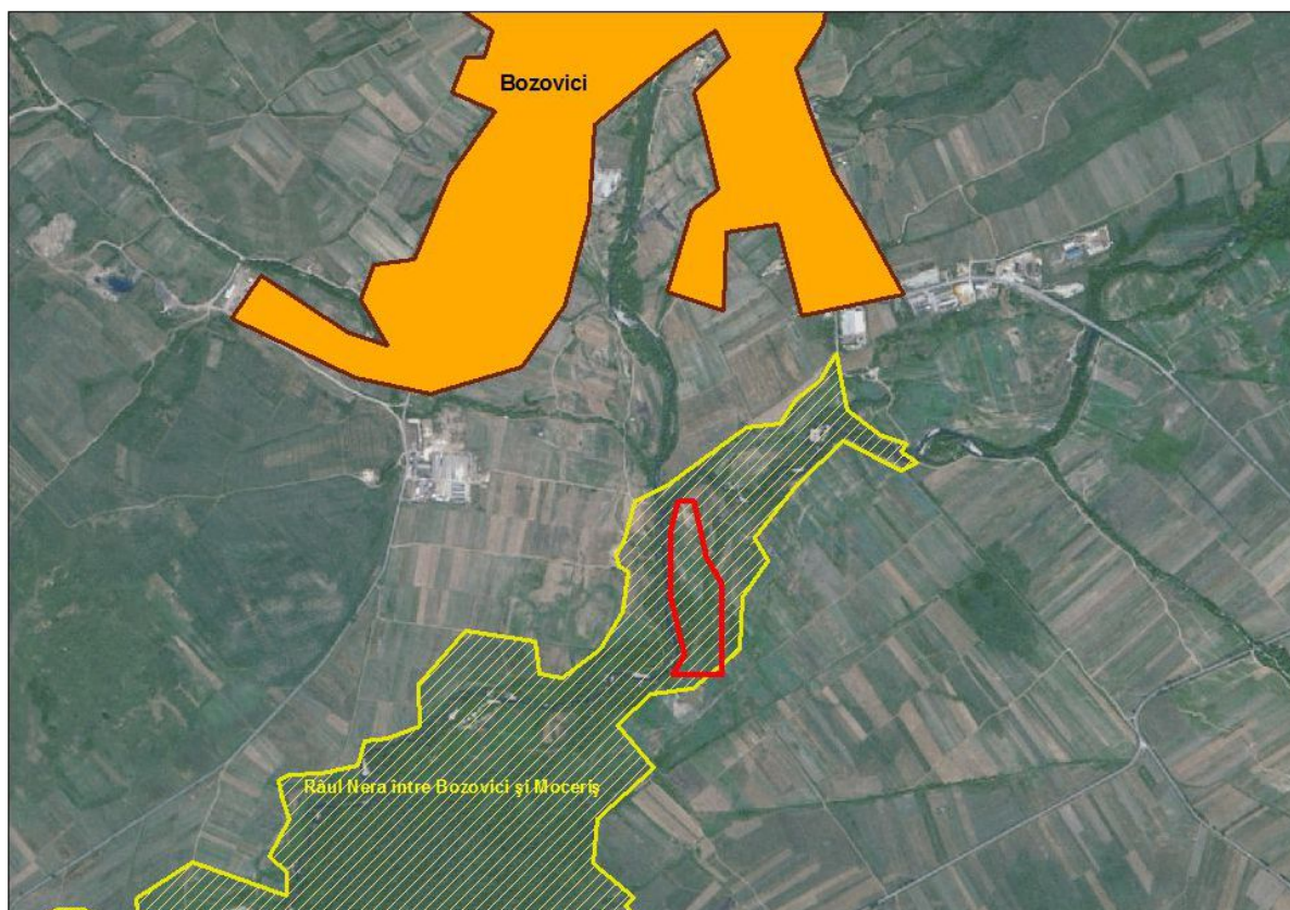
Figura nr. 2. Harta suprapunerii – ROSCI0375 Răul Nera între Bozovici și Moceris peste perimetrul de explorare Valea Băniei

Situl se localizează pe râul Nera în zona albiei minore a acestuia după coordonatele: